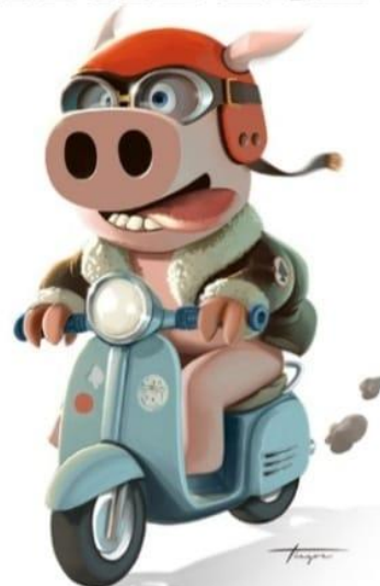
Illustrazione di Tigo Colapri - www.ingegner.com