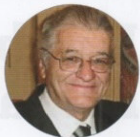
di Guglielmo Guidi